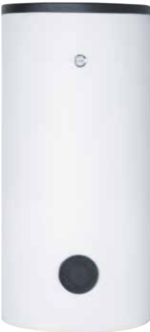
Vorderansicht ab 400 L